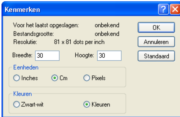
Figuur 3 Kenmerken in Windows XP